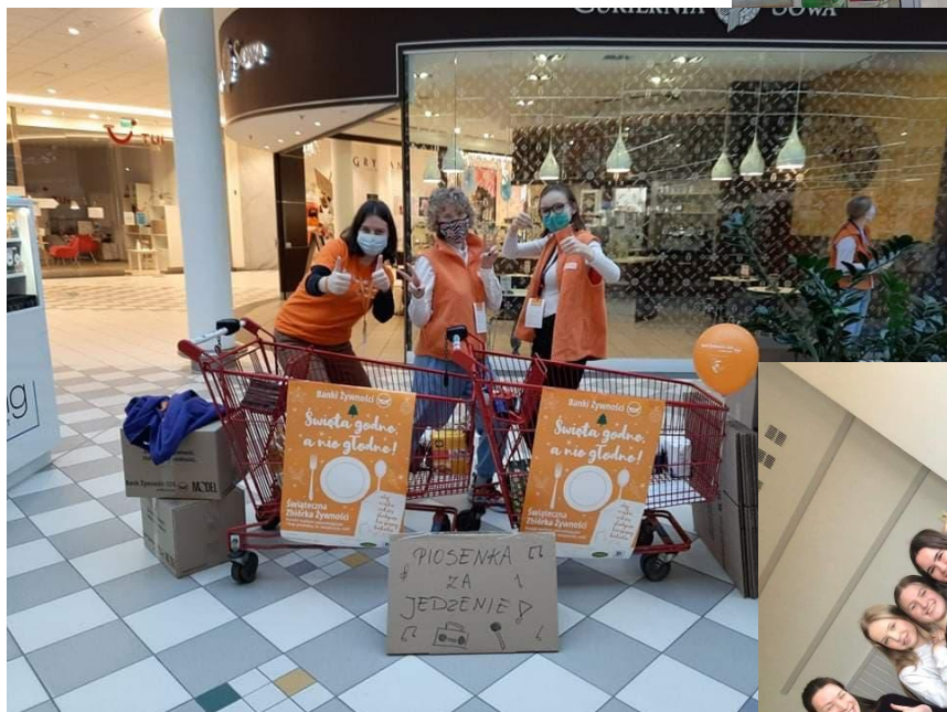
Świąteczna zbiórka żywności