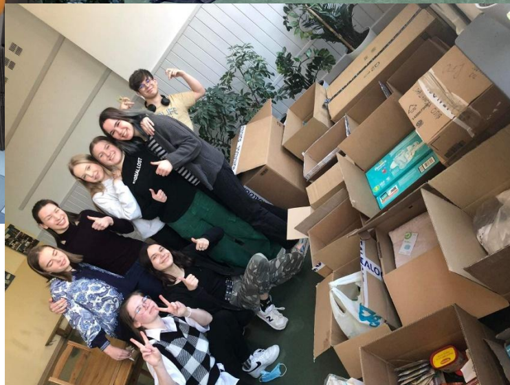
Pakowanie artykułów dla uchodźców z Ukrainy