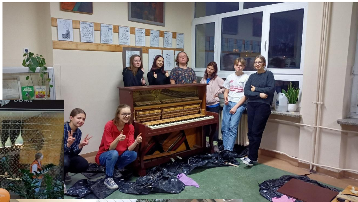
Przemaalowanie szkolnego pianina