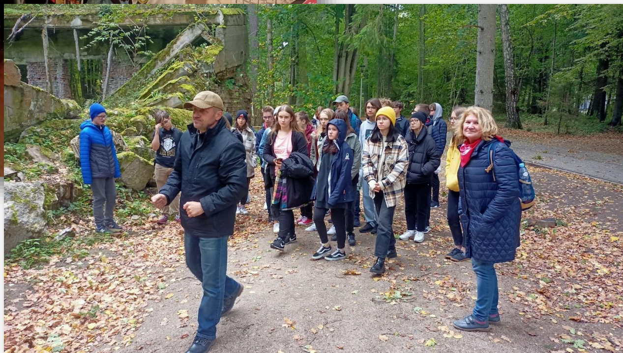
Wizyta w „Wilczym Szańcu”