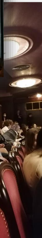
Jedna z wizyt w Teatrze Wielkim w Warszawie