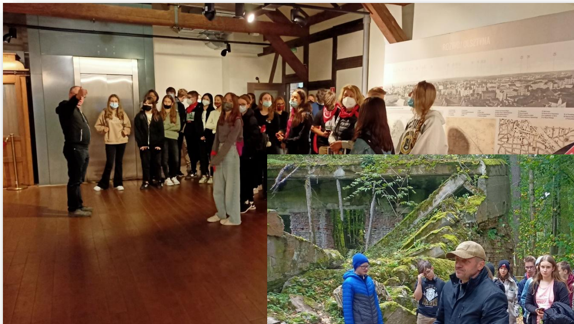
Wizyta w olsztyńskim Muzeum Nowoczesności