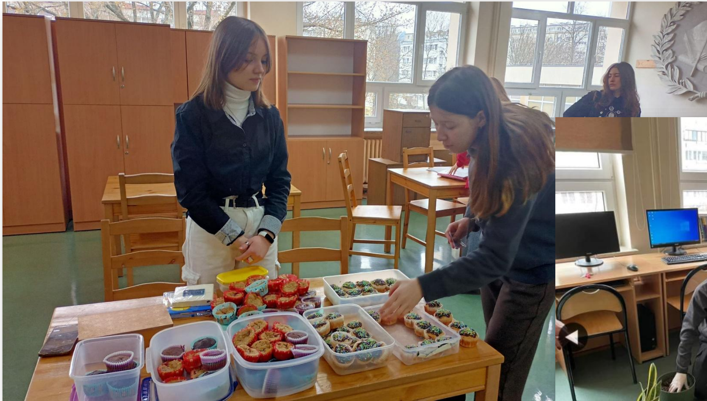
Akcja „Babeczki z nieprzygotowaniem”, z których dochód przeznaczaliśmy na sierociniec we Lwowie